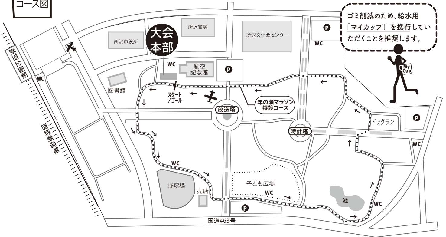
.....年の瀬マラソン特設コース15周