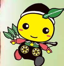
毛呂山町 マスコットキャラクター もろ丸くん