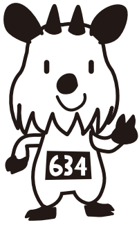
ムサッシー (ニホンカモシカ)